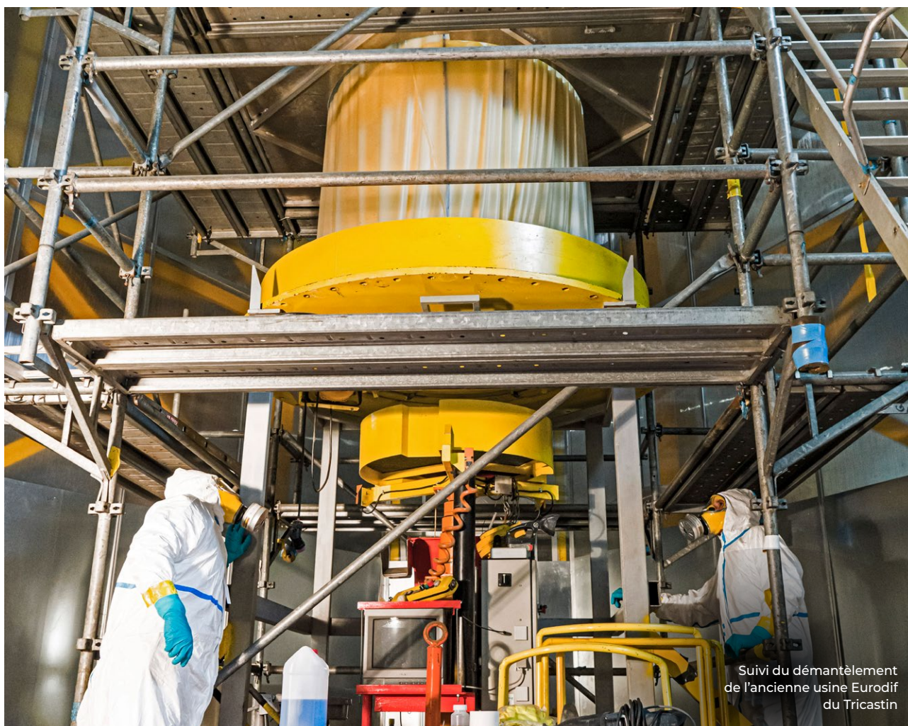
Suivi du démantèlement de l'ancienne usine Eurodif du Tricastin

Le démantèlement des installations nucléaires anciennes constitue un enjeu majeur pour Orano, qui doit mener, au cours des prochaines décennies, plusieurs projets de démantèlement de grande envergure : la première génération d'usine de traitement de combustible de La Hague, dénommée UP2-400 avec ses ateliers supports (Station de traitement des effluents STE2 et atelier de traitement des combustibles usés AT1, atelier de fabrication de sources radioactives ELAN IIB et atelier « haute activité oxyde », dénommé HAO), ainsi que les usines d'enrichissement et de conversion d'uranium du Tricastin.