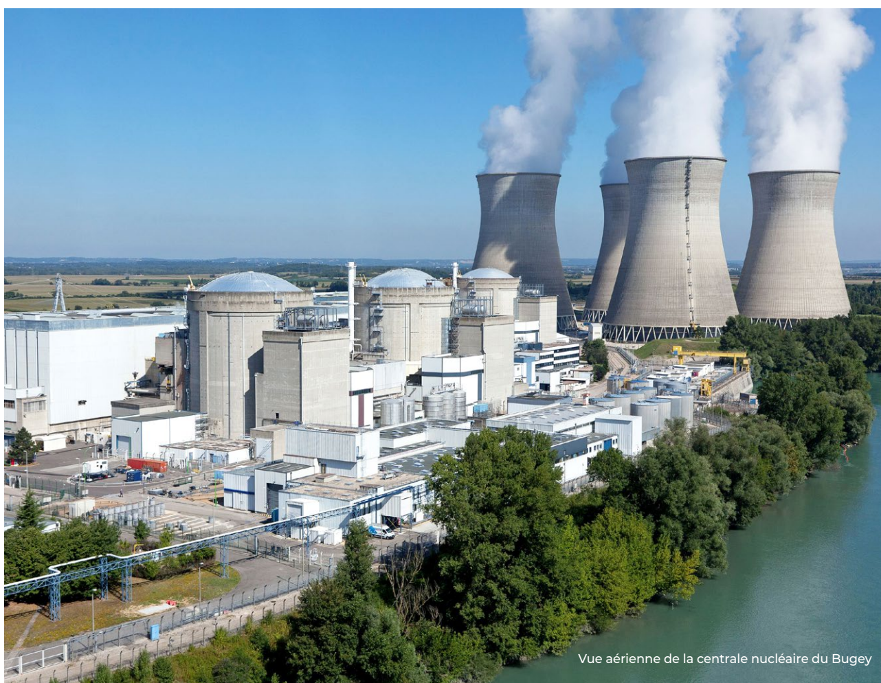
Vue aérienne de la centrale nucléaire du Bugey

Le quatrième réexamen périodique des réacteurs de 900 MWe se traduit par des améliorations importantes de la sûreté, dont le déploiement mobilise toute la filière nucléaire. L'ASN considère que les quatrièmes visites décennales se déroulent de manière plutôt satisfaisante jusqu'à présent.