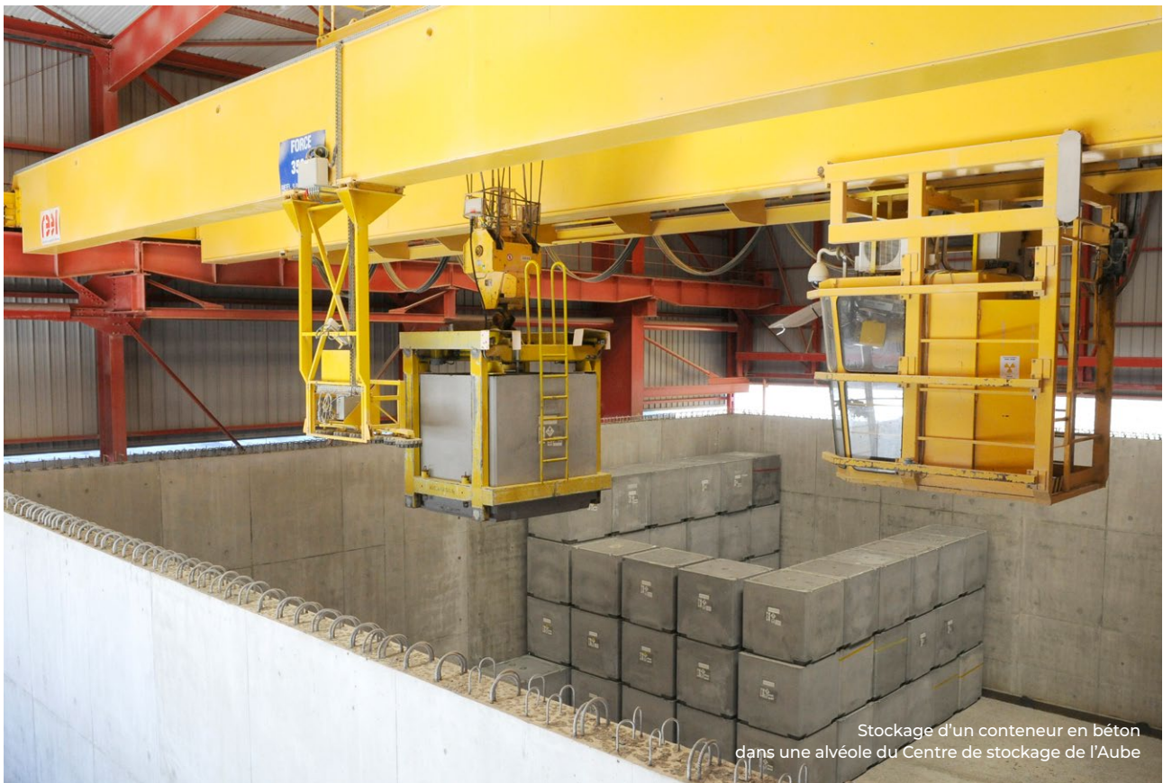
Stockage d'un conteneur en béton dans une alvéole du Centre de stockage de l'Aube

La loi n° 2006-739 du 28 juin 2006 de programme relative à la gestion durable des matières et déchets radioactifs a institué l'élaboration périodique d'un Plan national de gestion des matières et déchets radioactifs (PNGMDR). Celui-ci dresse un état des lieux détaillé des modalités de gestion des matières et des déchets radioactifs, que ces filières soient opérationnelles ou à mettre en œuvre, puis formule des recommandations ou fixe des objectifs pour le développement de ces filières.